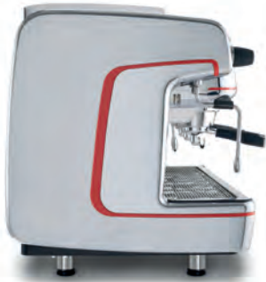
Tall Cup version